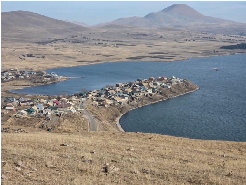
ტაბაწყურის ხედი „ნინოყალადან“.

სხვადასხვა ქართული ფეოდალური სამეფო-სამთავროების ერთ სამეფოდ გაერთიანების პროცესი, ჯავახეთის ეს მონაკვეთი განსაკუთრებით მნიშვნელოვან პუნქტად იქცა. ამაზევე მეტყველებს სამეფო რეზიდენცია-სადგომების გადმოტანა ჯავახეთის პლატოს სამხრეთი ნაწილიდან მის ჩრდილო ნაწილში, უშუალოდ ტაბაწყურის მიმდებარედ. ეს მიდამოები უშუალოდ მეფის გავლენის ქვეშ მოექცა (ბერძენიშვილი, 1985: 102; წიქარიშვილი, ბერიძე და სხვ., 2025: 37-41).